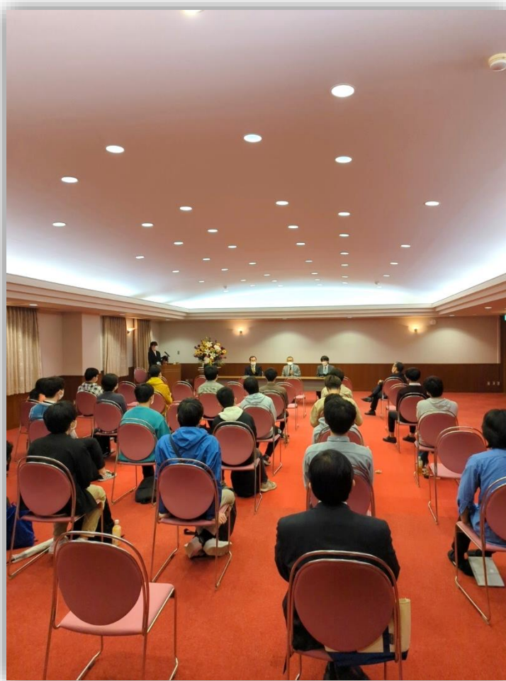
学生との懇親会の様子