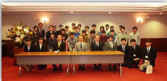
懇親会参加者との記念撮影