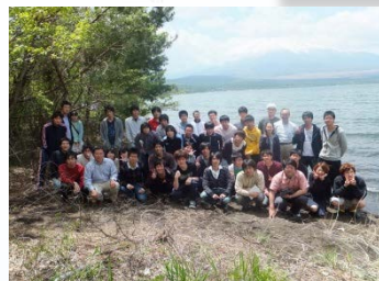
◇ 研究室合同ゼミ合宿 ◇