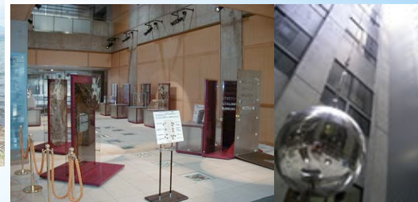
◇ サイエンスプロムナードと巨大フォーコー振り子 ◇